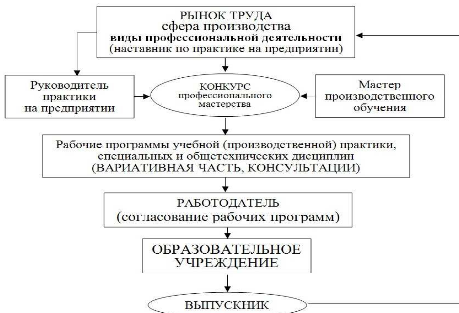
Рисунок 3. Взаимодействие образовательного учреждения и сферы производства

Производственная практика обучающихся колледжа проводится на основе прямых договоров на базовом предприятии нашего образовательного учреждения – ОАО УАЗ и начинается не с третьего курса, как это обычно предусмотрено, а со второго. Этим решается проблема материально-технического обеспечения: если новейшее оборудование «не идет» к обучающемуся (в образовательном учреждении), то приходится ученика «выводить» к новейшему оборудованию и технологиям современного непрерывно модернизируемого производства.