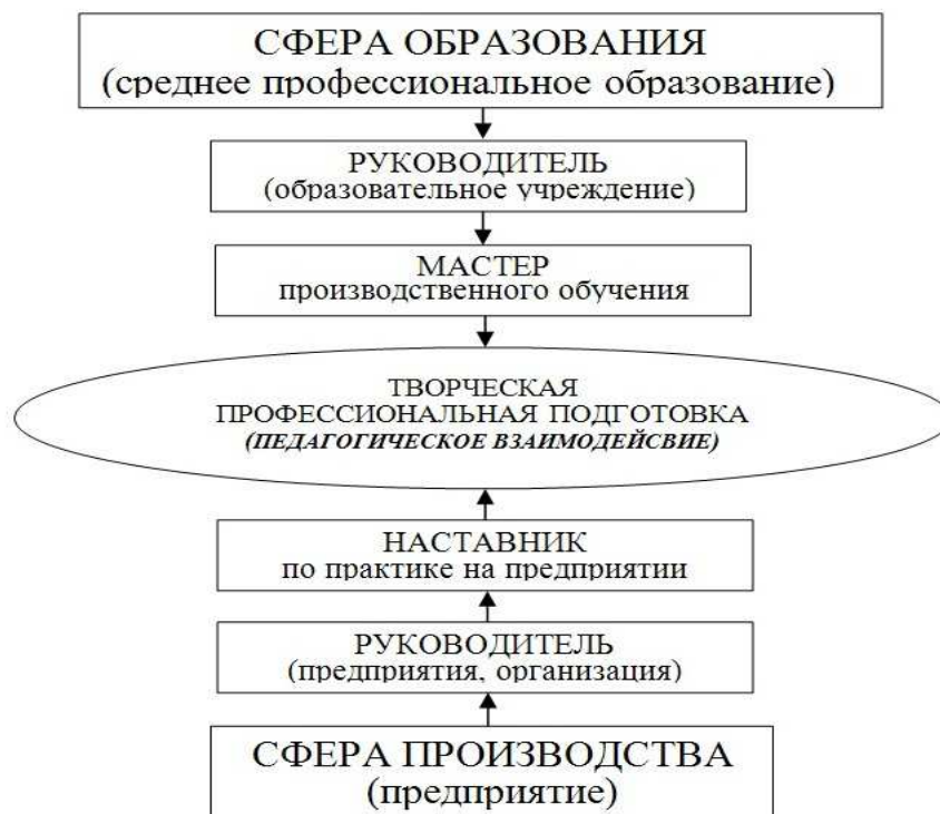
Рисунок 1. Схема педагогического взаимодействия

предприятия в реализации творческой профессиональной подготовки квалифицированного рабочего, обеспечивающее его компетенции, адекватные требованиям рынка труда и отвечающее интересам личности обучающегося, предприятия, государства. Схема взаимодействия сферы образования и производства представлена на рис. 1.