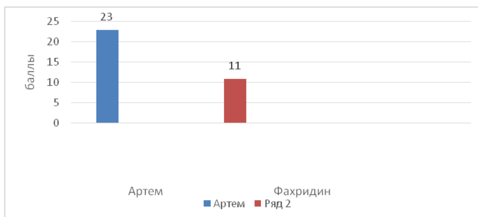
Рис.2. Уровень сформированности проектных навыков обучающегося с нормативным развитием и инклюзируемого обучающегося с задержкой психического развития. Итоги индивидуальной беседы констатирующего эксперимента

Из приведенной выше таблицы 4 видно, что обучающегося с нормативным развитием можно отнести в группу актуального развития навыка, а инклюзируемый обучающийся вновь относится к группе низкого уровня развития проектных навыков.