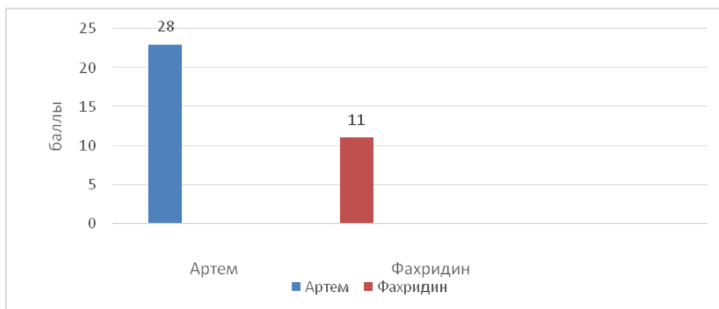
Рис.4. Уровень сформированности проектных навыков обучающегося с нормативным развитием и инклюзируемого обучающегося с задержкой психического развития. Итоги индивидуальной беседы контрольного эксперимента

7 вопрос – у обучающегося с нормативным развитием трудностей в ответе на данный вопрос не возникло. Мальчик перечислил такие трудности, как поиск важной и интересной информации или создание красивых спецэффектов на компьютере и др. Обучающийся с задержкой психического развития не смог определить, с какими трудностями он мог бы столкнуться при работе над проектом в дальнейшем. Тогда был задан вопрос, какие трудности у тебя возникали, когда ты работал над проектами (реализованными в рамках специальной программы по развитию базовых проектных навыков). В этом случае обучающийся смог дать краткий ответ о том, что ему требовалась помощь в практических заданиях, в создании презентации, в подборе информации.