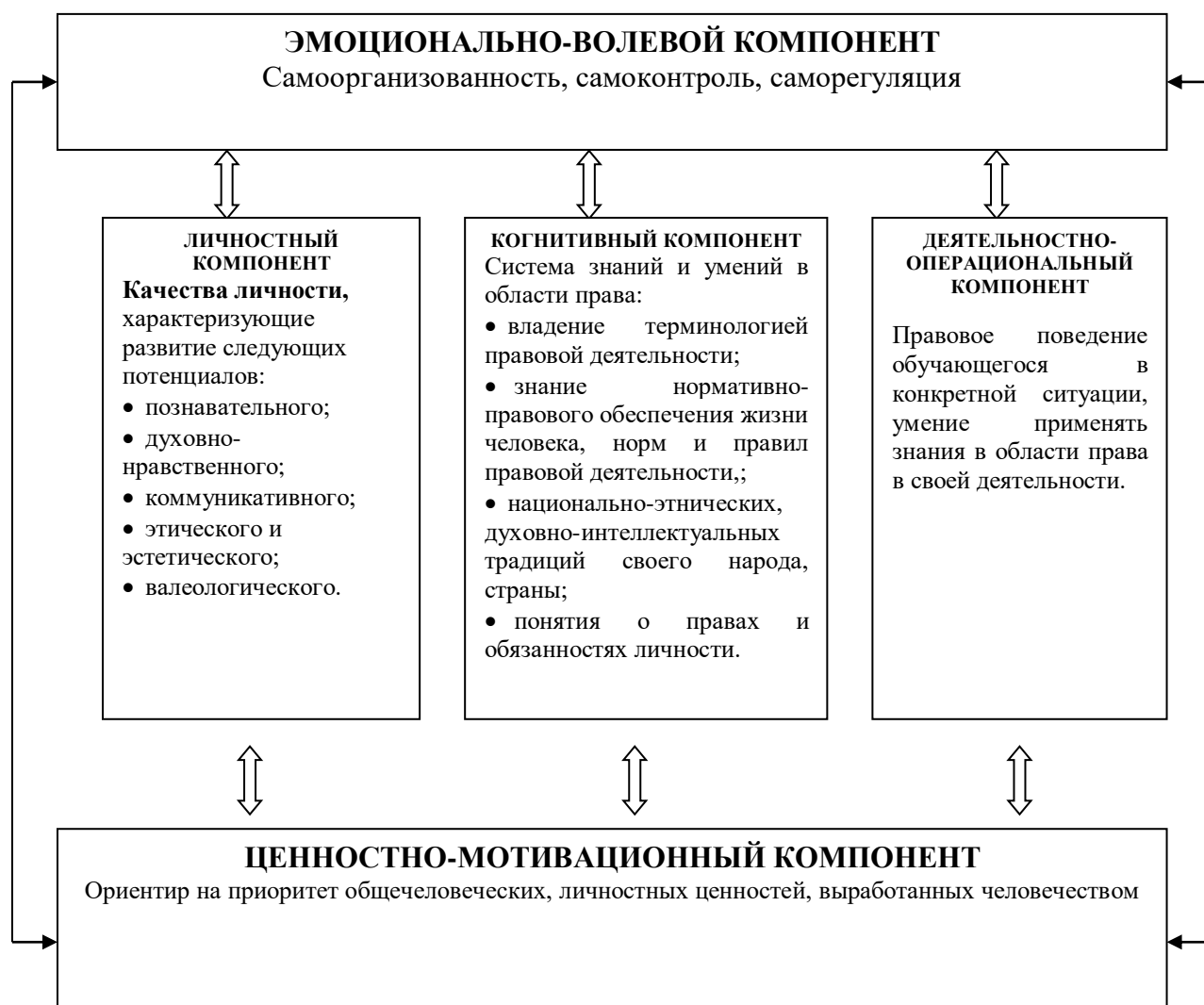
Рис.1. Структурная модель правовой культуры обучающихся

В рамках первого подхода в структурной модели правовой культуры обучающегося выделяют 5 компонентов: эмоционально-волевой, ценностно-мотивационный, личностный, когнитивный, деятельностно-операционный (рис.1).