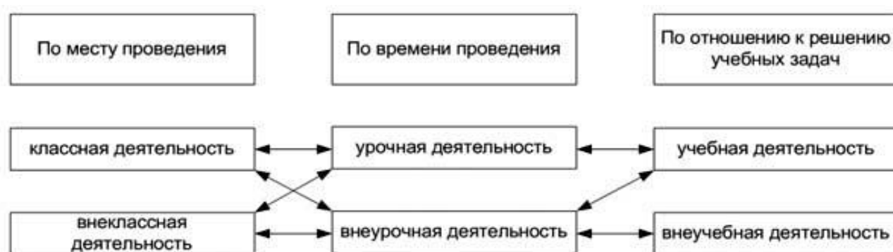
Рис.2. Взаимосвязь различных видов деятельности школьников

В классификации видов деятельности школьников А. Л. Трофимовой внеучебная деятельность занимает определенную позицию (рис.2).