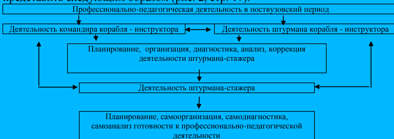
Рис.2 Деятельность командно-инструкторского состава учебно-авиационного полка по организации процесса формирования готовности штурмана-инструктора (стажера) к профессионально-педагогической деятельности в период ввода в строй.

Используя в совокупности весь имеющийся материал, структуру деятельности командно-инструкторского состава учебно-авиационного полка по организации процесса формирования готовности штурмана-стажера к профессионально-педагогической деятельности в период ввода в строй можно представить следующим образом (рис. 2, стр. 17).