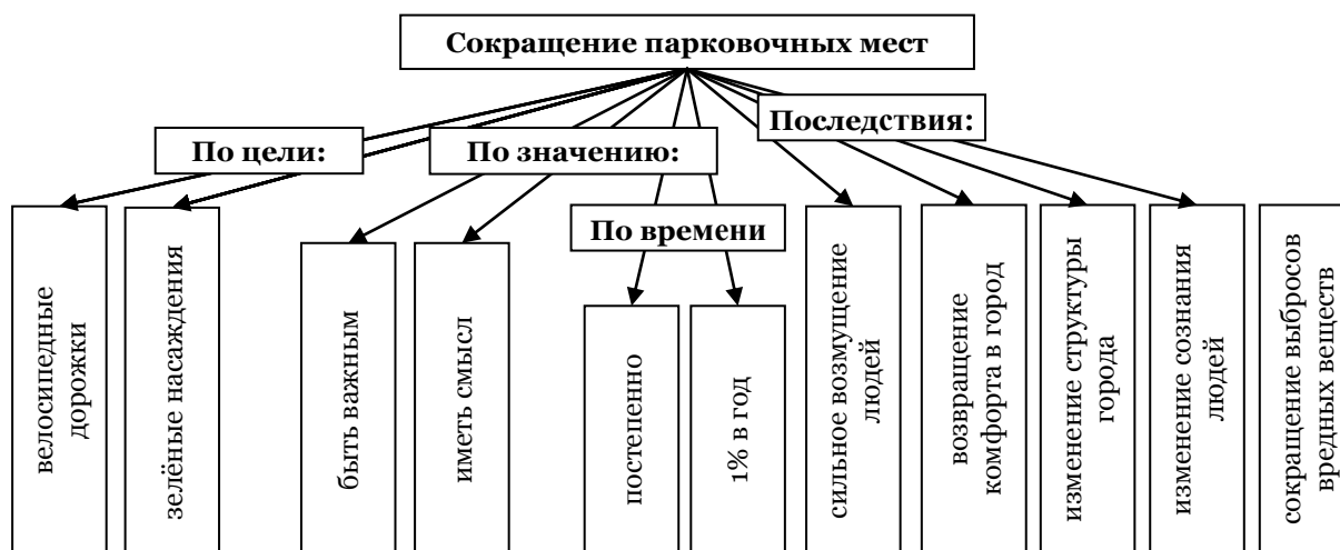
Рис. 4. Программа свернутого смыслового содержания фрагмента текста-высказывания

главный предикат как рема. Так, если переводчик слушает исходный текст выступления на немецком языке, чтобы перевести его на русский язык, то после прослушивания по смыслу завершенного фрагмента (1–3 абзацы) он может зафиксировать процесс свертывания главной мысли в виде конкретной структуры – смыслокомплекса (рисунок 4).