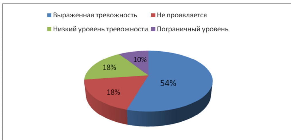
Рис.1. Отображение уровня тревожности в 1 классе

Таким образом, мы видим, что признаки тревожности присутствуют у большинства детей в той или иной мере.