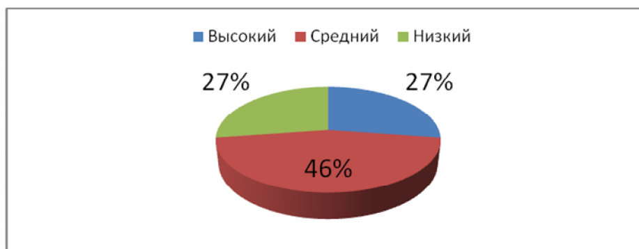
Рис.3 Распределение первоклассников по уровням социальной адаптации

Таким образом, в данной группе мы можем видеть все три уровня адаптации.