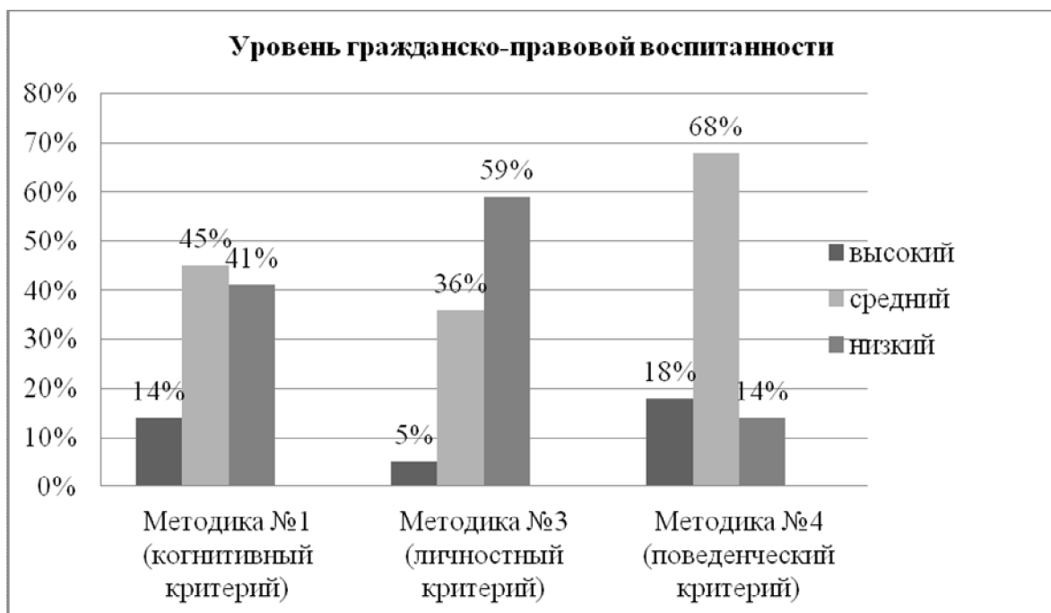
Рис.1. Результаты первичной диагностики уровня гражданско-правовой воспитанности обучающихся 2 «Б» класса

В ходе исследования проведена работа с классными руководителями начальной школы, им было предложено ответить на два вопроса: