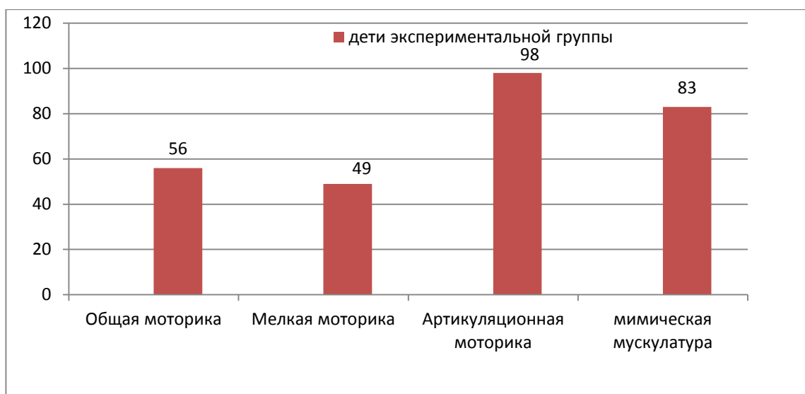
Рис. 1. Обследование состояния моторных функций до контрольного эксперимента детей экспериментальной группы

Таким образом, в ходе полученных данных, можно сделать вывод по общему среднему показателю моторных функций у детей экспериментальной группы (Рисунок 1. Обследование состояния моторных функций до контрольного эксперимента детей экспериментальной группы).