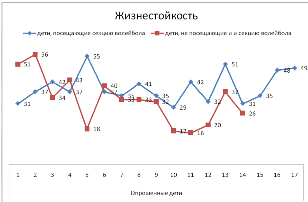
Рис. 4. Жизнестойкость

Анализируя, получившиеся в итоге, графики жизнестойкости мы четко видим закономерность: жизнестойкость у детей, посещающих секцию волейбола в основной своей массе выше, чем у детей, не занимающихся в секции. Исключения из этой закономерности мы отнесем к влиянию, оказываемому на воспитание жизнестойкости, микросоциума (к которому мы отнесем семью и ближайшее окружение) и к индивидуальным особенностям психики конкретно взятого ребенка.