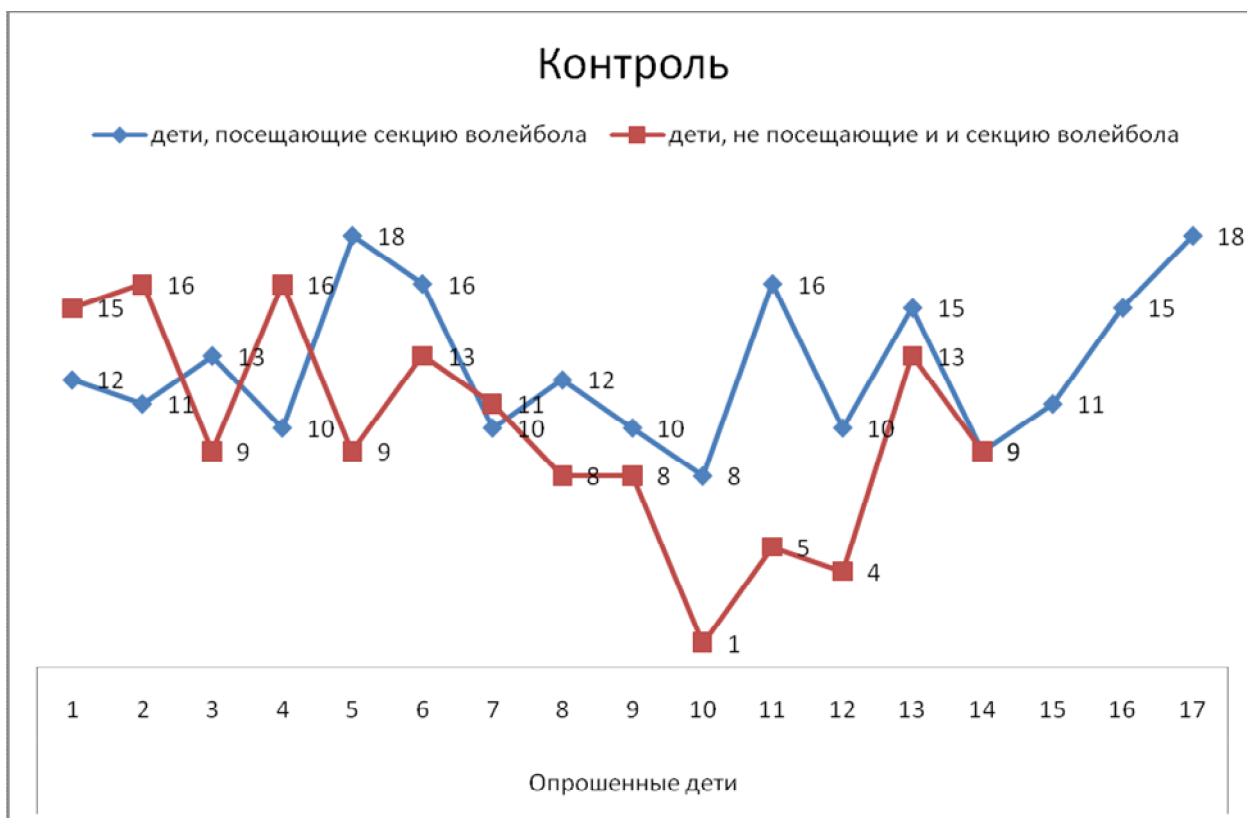
Рис. 2. Компонент «Контроль»

при этом удовольствие и признание. С другой стороны, ребенку из неблагополучной семьи, даже при активном посещении объединений учреждения дополнительного образования, будет не хватать для уверенности в себе поддержки и помощи со стороны семьи.