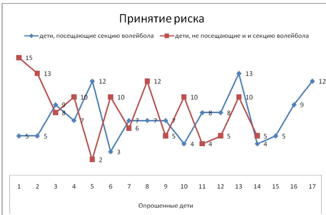
Рис. 3. Компонент «Принятие риска»

образовательные потребности детей в соответствии с их интересами успешно организуют такую среду для детей, где дети получают не только знания, но и поддержку, наставления, общение и жизненный опыт. Также как и с компонентом вовлеченности, здесь есть исключения, которые можно трактовать с тех же позиций: на воспитание такого качества личности как контроль помимо учреждений дополнительного образования оказывает влияние (вносит свой вклад) и семейное воспитание, которое может быть как позитивным, так и негативным, и индивидуальные особенности личности каждого конкретного ребенка.