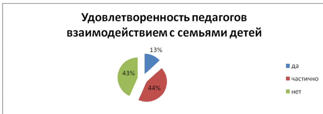
Рис. 2 Результаты анкеты № 2