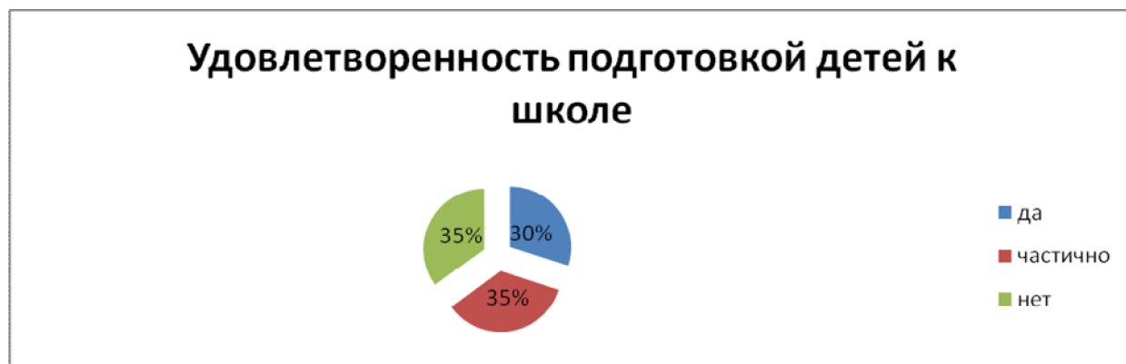
Рис. 3 Результаты анкеты № 3