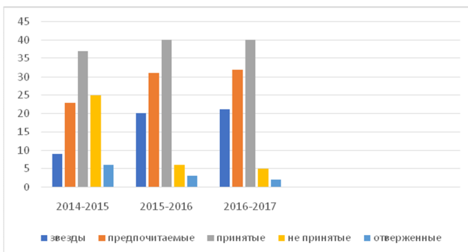
Рис.3. Результаты социометрического исследования психологического климата в коллективе MAOU СОШ № 2.

Сравнительный анализ диаграмм социометрии за три учебных года наглядно показывает положительные изменения социально-психологического климата в MAOU СОШ № 2 (см. рис. 3).