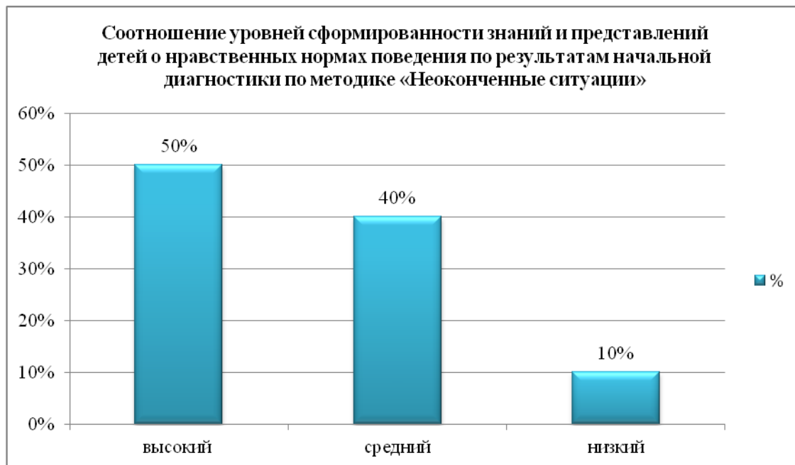
Рис. 1. Соотношение уровней сформированности знаний и представление детей о нравственных нормах поведения

Соотношение уровней сформированности знаний и представлений детей о нравственных нормах поведения представлено в рисунке 1.