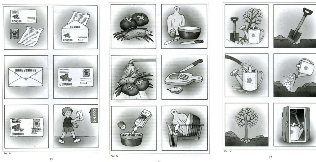
Рисунок 1. «Лото»

1 балл – ребенок не понимает и не принимает задание взрослого и алгоритм действий.