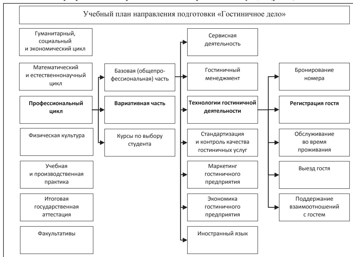
Рис. 1. Место модуля в образовательном процессе

Регистрация гостя является частью гостиничного цикла, поэтому реализация модуля происходит в контексте этапов гостиничного цикла и предполагает освоение технологии бронирования до изучения процесса регистрации, а также изучение последующих процедур: обслуживания во время проживания, выезда, решения конфликтных ситуаций (рис. 1).