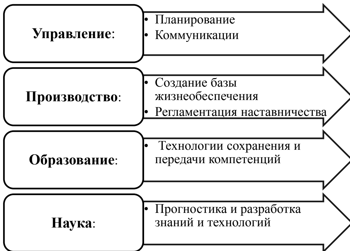
Рис. 2. Базовые компоненты системы наставничества

Базовыми компонентами системы наставничества в организации являются (рисунок 2).