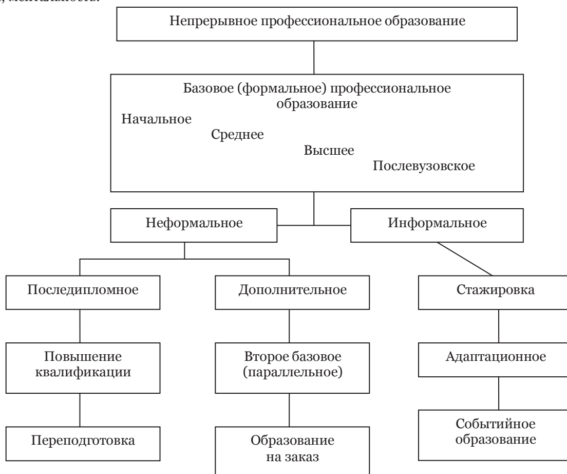
Рисунок 1. Формы непрерывного профессионального образования

На рисунке 1 изображены формы непрерывного образования.