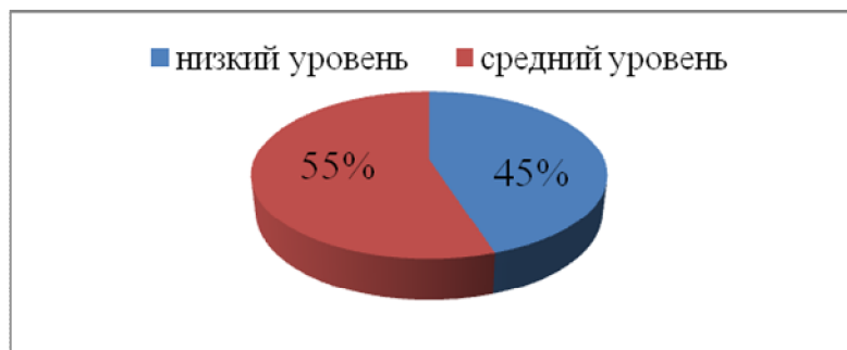
Рис. 1 Уровень правовой грамотности старших подростков

Таким образом, правовая грамотность 11А класса находится на среднем уровне.