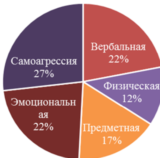
Рис. 3 Соотношение форм агрессивного поведения у литературно-поэтически одарённых детей

В частности, в структуре их агрессивного поведения преобладают такие формы проявления агрессивного поведения как: самоагрессия, эмоциональная агрессия и вербальная агрессия (см. рис. 3).