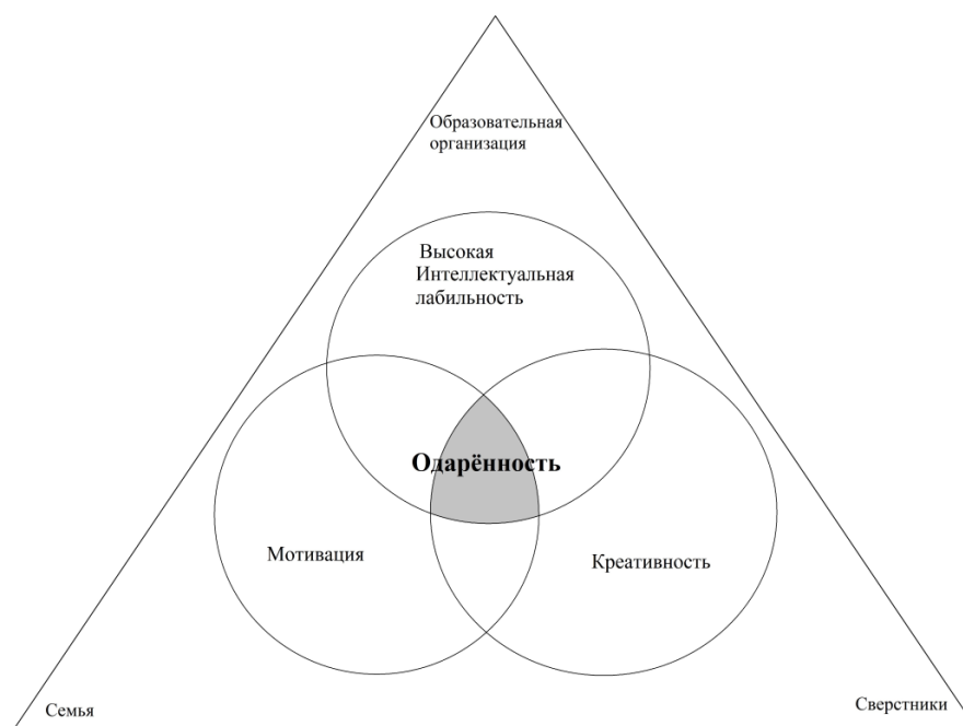
Рис. 1. Мультифакторная модель одарённости

Помимо дискуссий вокруг понятия «одарённость», существует множество классификаций видов одарённости.