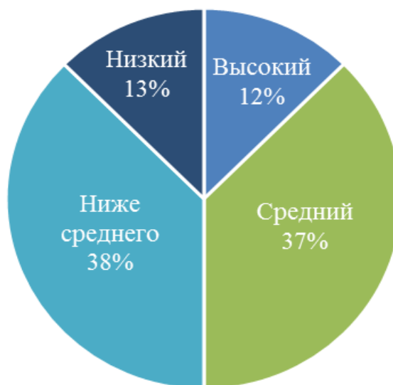
Рис. 4 Уровни нравственной самооценки литературно-поэтически одарённых детей

На рис. 4 представлены результаты диагностики нравственной самооценки литературно-поэтически одарённых детей.