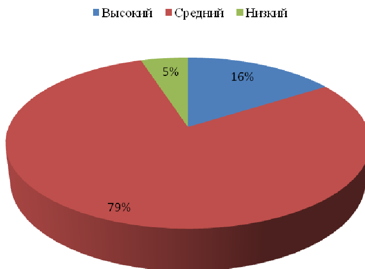
Рис.1 Результаты методики «Правовые знания»

Таким образом, по результатам данной методики, можно сделать вывод, что в 7 классе преобладает средний уровень (у 79% обучающихся). Высокий уровень показали только 16% семиклассников (3 человека). Также у одного ученика (5%) был выявлен низкий уровень правовых знаний. А на