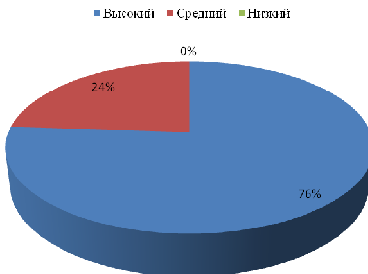
Рис. 3 Уровень сформированности поведенческого компонента

действующим законодательством (правомерное поведение), добросовестно выполняют свои обязанности.