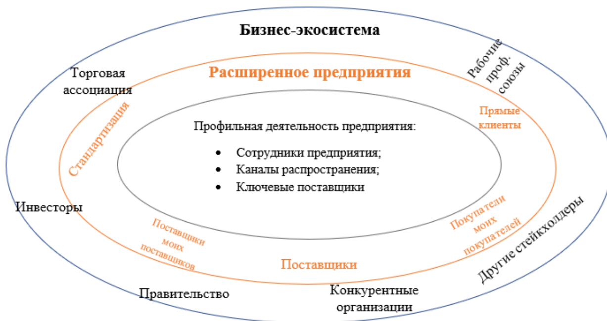
Рисунок 3 – Среда развития компании, выпускающей продукт на основе технологии «Умный дом»

Большинство стартапов, применяющих технологию «Умный дом» находятся еще на стадии зарождения, а именно, характер и логика рынка еще не до конца ясны. В связи с этим компаниям необходимо сначала определить сотрудников, компетентных специалистов, которые смогут поддерживать данный уровень новшества технологий. Так же компаниям необходимо определять своих потенциальных покупателей для того, чтобы понять, кто будет их основными потребителями, а также для дальнейшего расширения рынка.