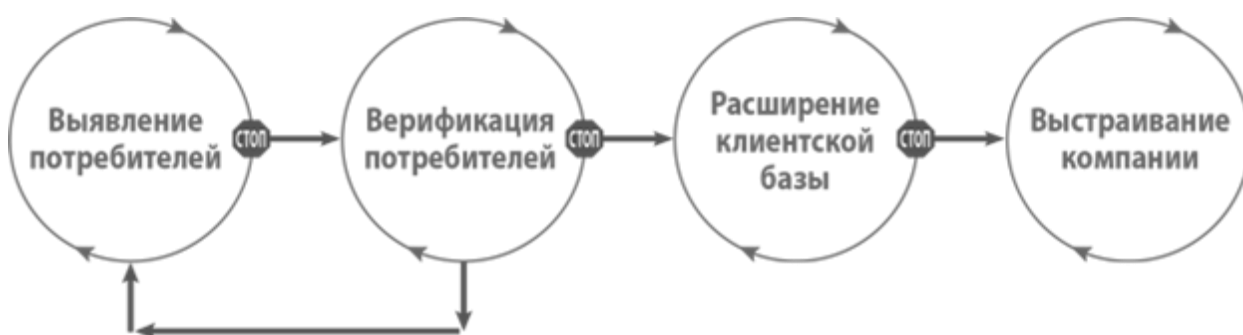
Рисунок 4. Модель развития потребителей (клиентов)

В зависимости от рынка проводятся экспертные опросы и интервьюирования. И вроде бы все проверено и обосновано – а результат тот же. Именно Customer development позволяет максимально приблизить наше представление к реальным потребностям людей, к их пониманию нужности и полезности продукта. Причем до того, как этот продукт станет серийным.