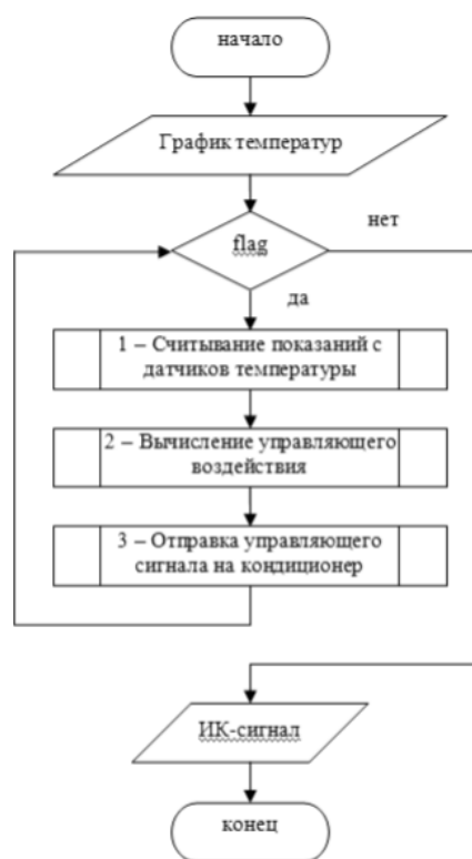
Рисунок 1 – Алгоритм управления температурным режимом на базе технологии LanDrive