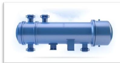
Рис. 2. Теплообменник

Пример. В профессиональной деятельности инженера-технолога необходимо уметь подбирать теплообменный аппарат под заданный процесс. Теплообменник — это аппарат, в котором осуществляется передача тепла от одного вещества (теплоносителя) к другому (Рис. 2). Движущей силой теплового процесса является разность температур сред, участвующих в теплообмене.