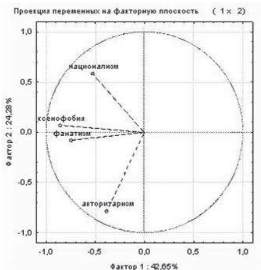
Рис. 1. Факторные координаты показателей шкал анкеты

АНАЛИЗ РЕЗУЛЬТАТОВ. При формировании выборки деление на классы (группы) не проводилось, поскольку в процессе обучения (в 7 и 9 классах) учащиеся смешивались, составы классов нестабильны, а опыт общения и теснота проживания предполагает, что учащиеся взаимодействуют и вне школьных коллективов. Поэтому данные анкетного опроса обобщены в едином пространстве. С помощью методов классификации установлена факторная структура показателей «Фанатизм», «Национализм», «Ксенофобия», «Авторитаризм» в опрошенных учебных коллективах (рис. 1).