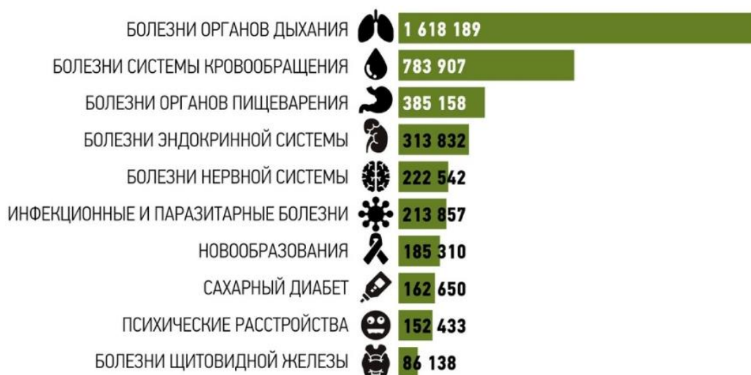
Рис.3. Нозологический профиль заболеваний Свердловской области, 2017 г. [32].

По данным Минздрава России именно болезни респираторного тракта и аллергические заболевания - экологически зависимые патологии, так как фенотипическая реализация наследственной предрасположенности к ним всегда осуществляется при воздействии факторов окружающей среды. Согласно научным трудам, вклад загрязнения атмосферного воздуха в общую заболеваемость населения страны может составлять 44 % [17].