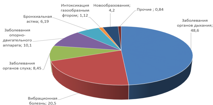
Рис.4. Структура хронической заболеваемости по видам нозологии в Свердловской области.

С загрязнением окружающей среды связывают и увеличение случаев заболевания раком лёгких. Доказано, что смертность от рака лёгких у жителей городов области на 30% выше, чем у жителей села.