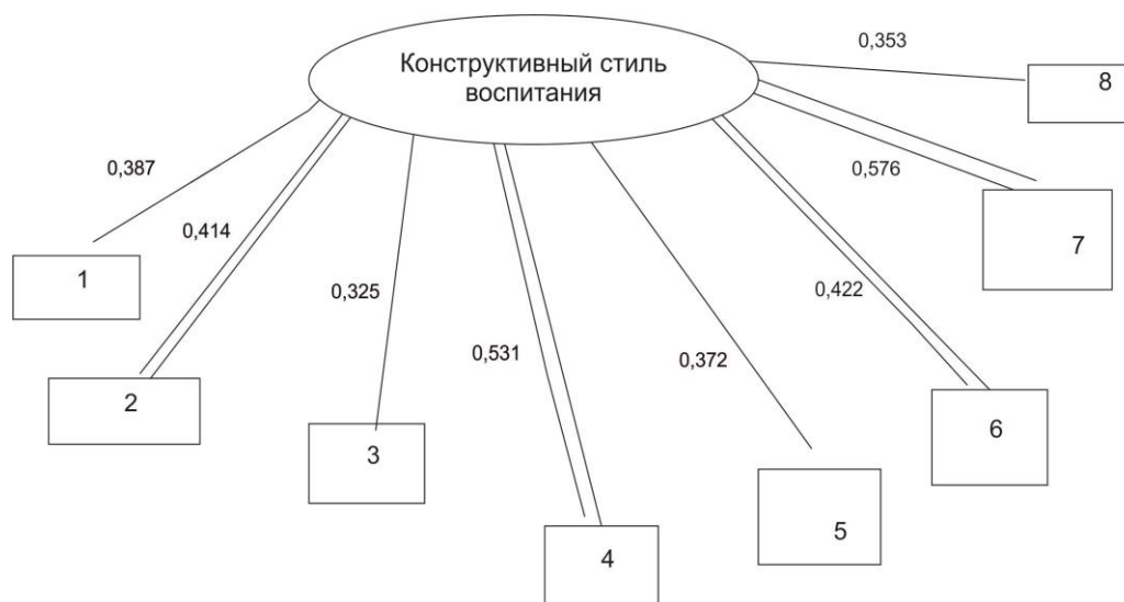
Рис. 3. Корреляционная плеяда связей страхов старших дошкольников с конструктивным стилем родительского воспитания

Примечание: 1 – социальные страхи; 2 – общее количество страхов; 3 – пространственные страхи; 4 – страх персонажей; 5 – боязнь животных; 6 – страх темноты; 7 – страх смерти; 8 – страх физического ущерба.