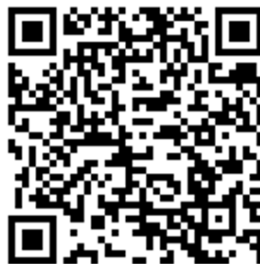
Рис. 2. QR-ссылка на подкаст с примером методики измерения постоянных напряжений