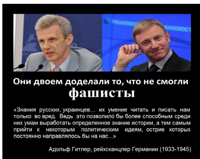
Рис.2 Политическая иллюстрация в отношении министров образования

Изображение бывших министров науки и образования РФ, а именно, А.А. Фурсенко и Д.В. Ливанова, является наиболее распространенной, из указанных выше тем. Причем, интересно отметить, что авторами создаются именно политические иллюстрации, а не карикатуры в отношении указанных политических деятелей.