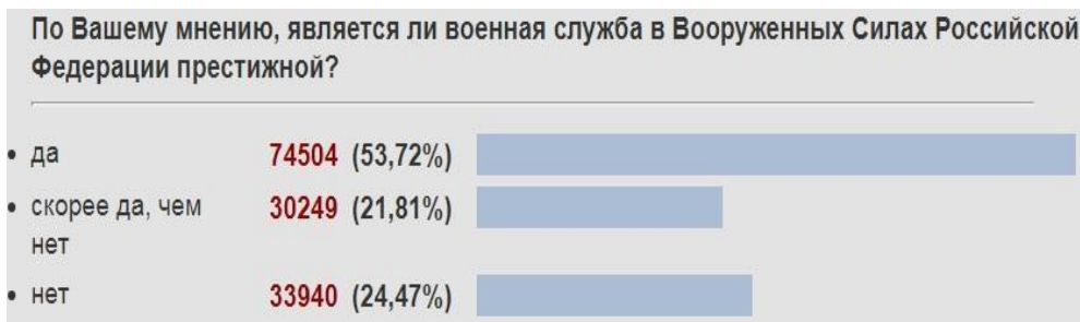
Рисунок 1. Результаты опроса на сайте МО РФ

С целью изучения отношения допризывников к воинской обязанности в период с 4.05.2020. по 8.05.2020. нами было проведено анкетирование обучающихся на тему «Служба в рядах Вооружённых сил РФ». В онлайн-опросе приняли участие учащиеся 9-11 классов МКОУ Обуховская СОШ Камышловского муниципального района (всего 45 человек). Результаты тестирования таковы: