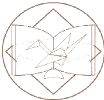
Рис. 2. Логотип образовательной программы «Медиация в образовании»

Системный характер обеспечения магистерской программы средствами интернет-технологий находит отражение в том числе в воплощении элементов мобильной информационно-образовательной среды и продвижении программы в цифровом пространстве за счет реализации адаптивного веб-дизайна компонентов информационной среды и создания сетевых сообществ в одних из наиболее популярных социальных сетях – «ВКонтакте», «Инстаграм», что, как ожидается, позволит существенно расширить охват аудитории, потенциально заинтересованной проблематикой конструктивного разрешения конфликтов средствами медиативных технологий [16], обеспечить как презентационную площадку программы в Сети, так и единое виртуальное пространство для дискуссий. Презентация программы академическим и профессиональным сообществам, продвижение ее идеологии подразумевается в том числе за счет переноса отдельных электронных курсов по про-