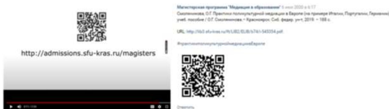
Рис. 4. Реализация элементов мобильного обучения в рамках электронного сопровождения

тальный переход к разделу сайта университета для абитуриентов, к содержанию программы вступительных испытаний по магистерской программе «Медиация в образовании».