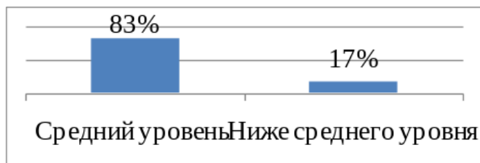
Рис. 1. Показатели уровня сформированности нравственной самооценки у обучающихся с умственной отсталостью (по методике Л. Н. Колмогорцевой)

У 17 % (1 человек) обследуемых обучающихся – уровень нравственной самооценки ниже среднего, т. е. данные обучающиеся недостаточно осведомлены о правилах нравственного поведения. Знания о нравственных нормах у них весьма приблизительны, а отношение к ним пассивно-нестабильно. Основные нравственные качества не полностью развиты, прежде всего ответственность, критичность, добросовестность, справедливость, чуткость, а если и проявляются, то только ситуативно.