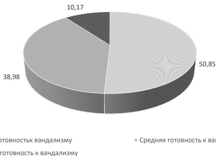
Рис. 1. Процентное распределение подростков по кластерам (общая выборка)

Результаты исследования и их обсуждение. Для ответа на первый исследовательский вопрос результаты по всей выборке были подвергнуты двухэтапному кластерному анализу, в результате чего обнаружены три гомогенных группы (силуэтная мера связности и разделения кластеров – хорошая) по степени выраженности общей мотивационной готовности к совершению вандалных действий. Процентное распределение респондентов по данным группам представлено на рисунке 1.