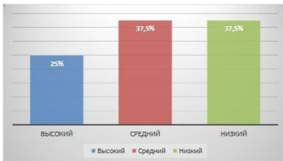
Рис. 1. Уровень сформированности нравственных представлений по когнитивному показателю, %

Рассмотрим далее результат выполнения диагностических заданий по ценностно-мотивационному показателю.