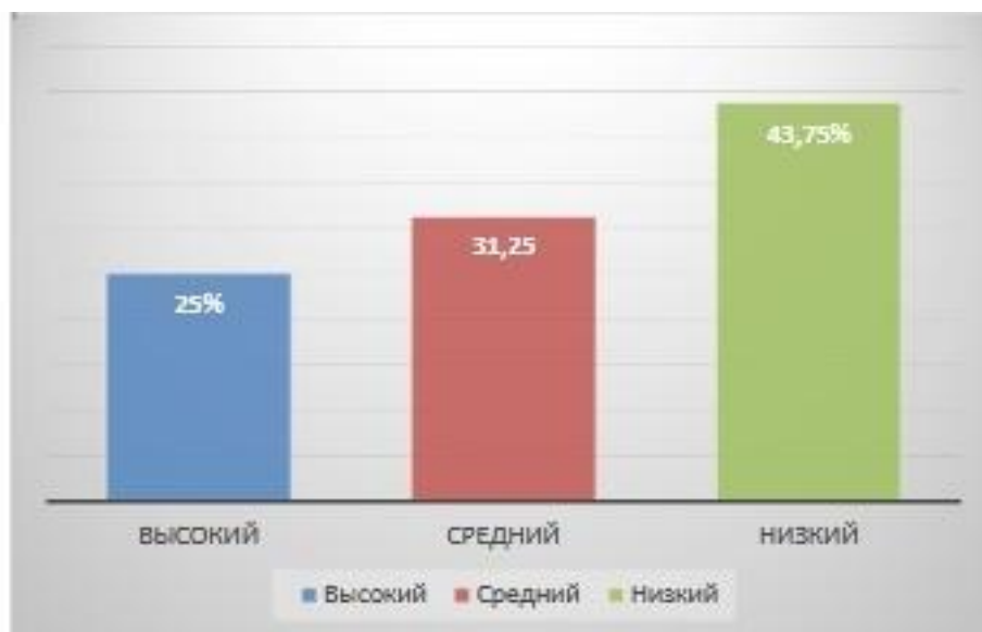
Рис. 3. Уровень сформированности нравственных представлений у детей среднего дошкольного возраста, %

Данные результаты отражены в рисунке №3.