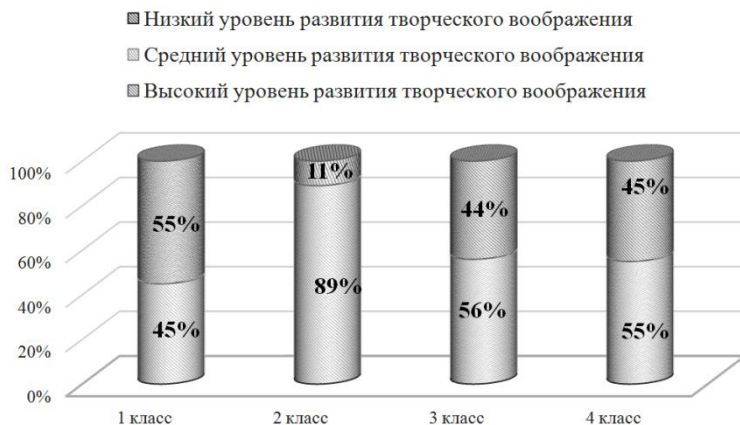
Рис. 1. Процентное распределение по уровням развития творческого воображения и классам обучающихся с нормативным речевым развитием