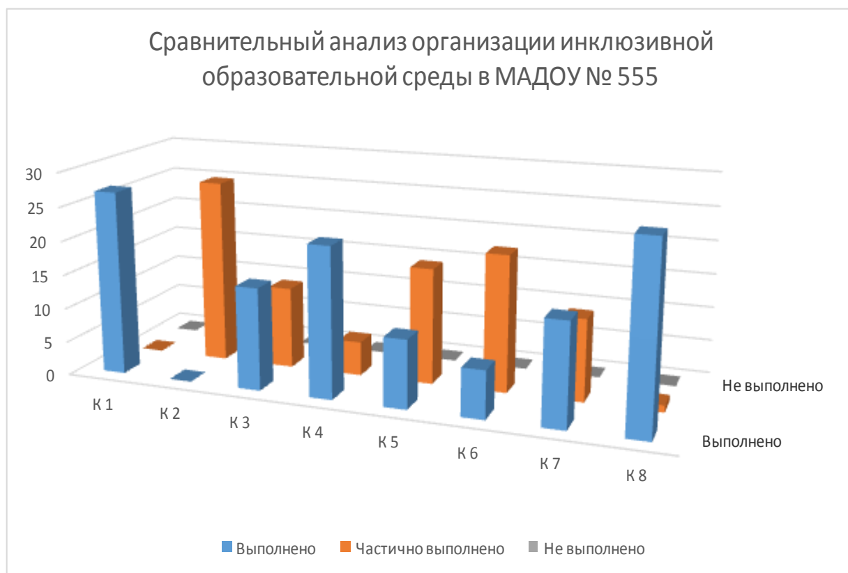
Рис.2 Сравнительный анализ итоговых баллов оценки организации инклюзивной образовательной среды на контрольном этапе в МАДОУ № 555

Сравнительный анализ итоговых баллов оценки организации инклюзивной образовательной среды в МАДОУ №555 представлен на диаграмме (Рис. 2)