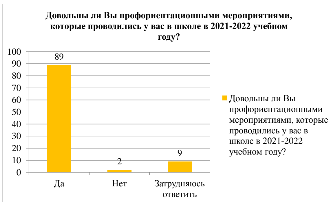
Рис.9. Распределение респондентов по ответам на вопрос «Довольны ли Вы профориентационными мероприятиями, которые проводились у вас в школе в 2021-2022 учебном году?», %

Итак, после реализации модульной программы уровень выраженности профессиональных склонностей старшеклассников улучшился. Так, увеличилось количество детей с высоким уровнем на 43%, со средним уровнем на 10% и сократилось число обучающихся с низким уровнем выраженности профессиональных склонностей на 53%, что говорит об эффективности разработанной нами программы. Изменился и уровень удовлетворенности родителей и старшеклассников проводимыми профориентационными мероприятиями. После внедрения модульной программы 89% респондентов остались довольными результатом профориентационной работы, что подтверждает эффективность разработанных нами мероприятий.