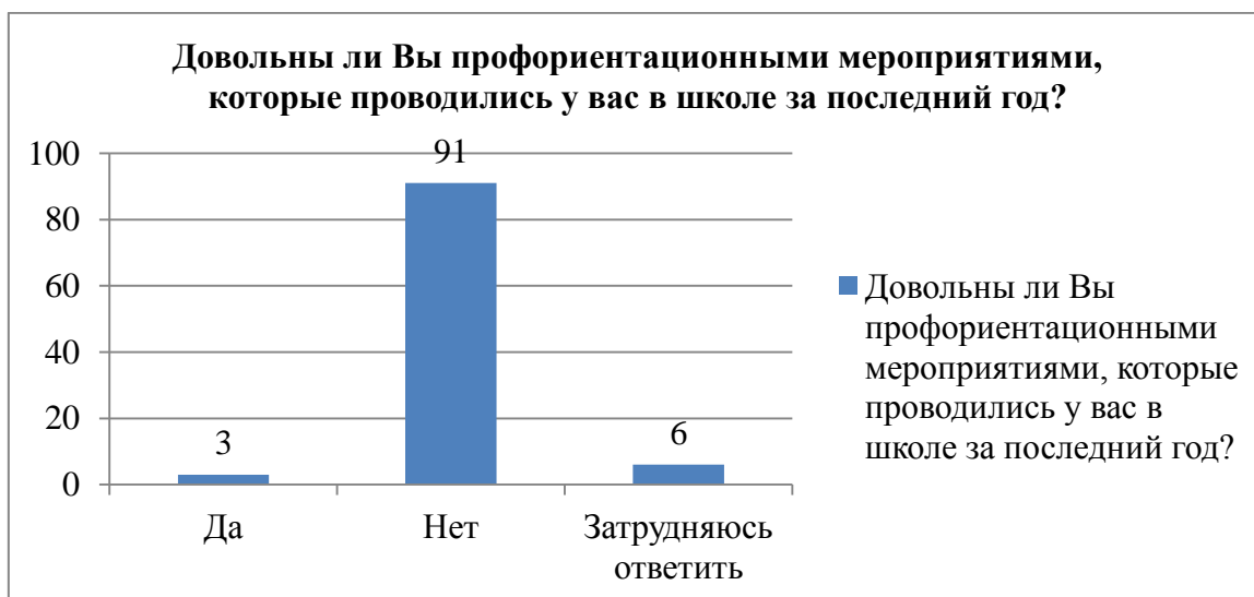
Рис.5. Распределение респондентов по ответам на вопрос «Довольны ли Вы профориентационными мероприятиями, которые проводились у вас в школе за последний год?», %

На вопрос «Довольны ли Вы профориентационными мероприятиями, которые проводились у вас в школе за последний год?» ответы респондентов распределились следующим образом (рис.5).