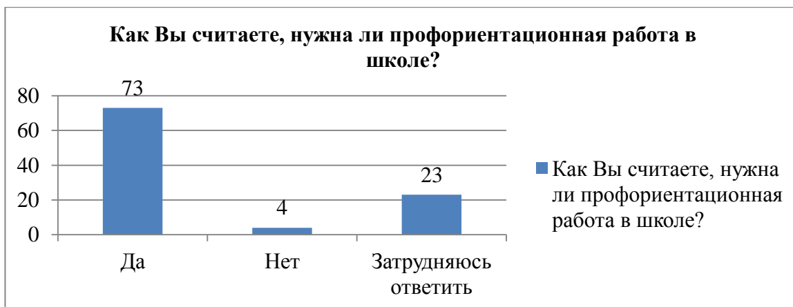
Рис.4. Распределение респондентов по ответам на вопрос «Как Вы считаете, нужна ли профориентационная работа в школе?», %

На вопрос «Довольны ли Вы профориентационными мероприятиями, которые проводились у вас в школе за последний год?» ответы респондентов распределились следующим образом (рис.5).