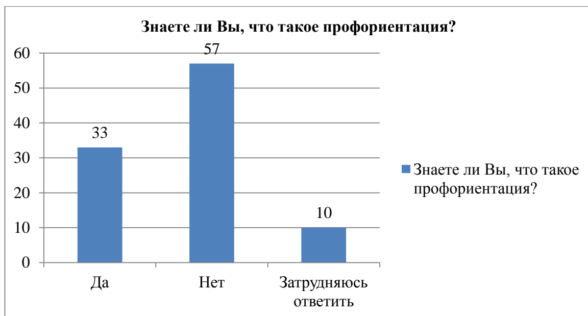
Рис.3. Распределение респондентов по ответам на вопрос «Знаете ли Вы, что такое профориентация?», %

Ответы респондентов на вопрос «Знаете ли Вы, что такое профориентация?» продемонстрированы на рис.3.