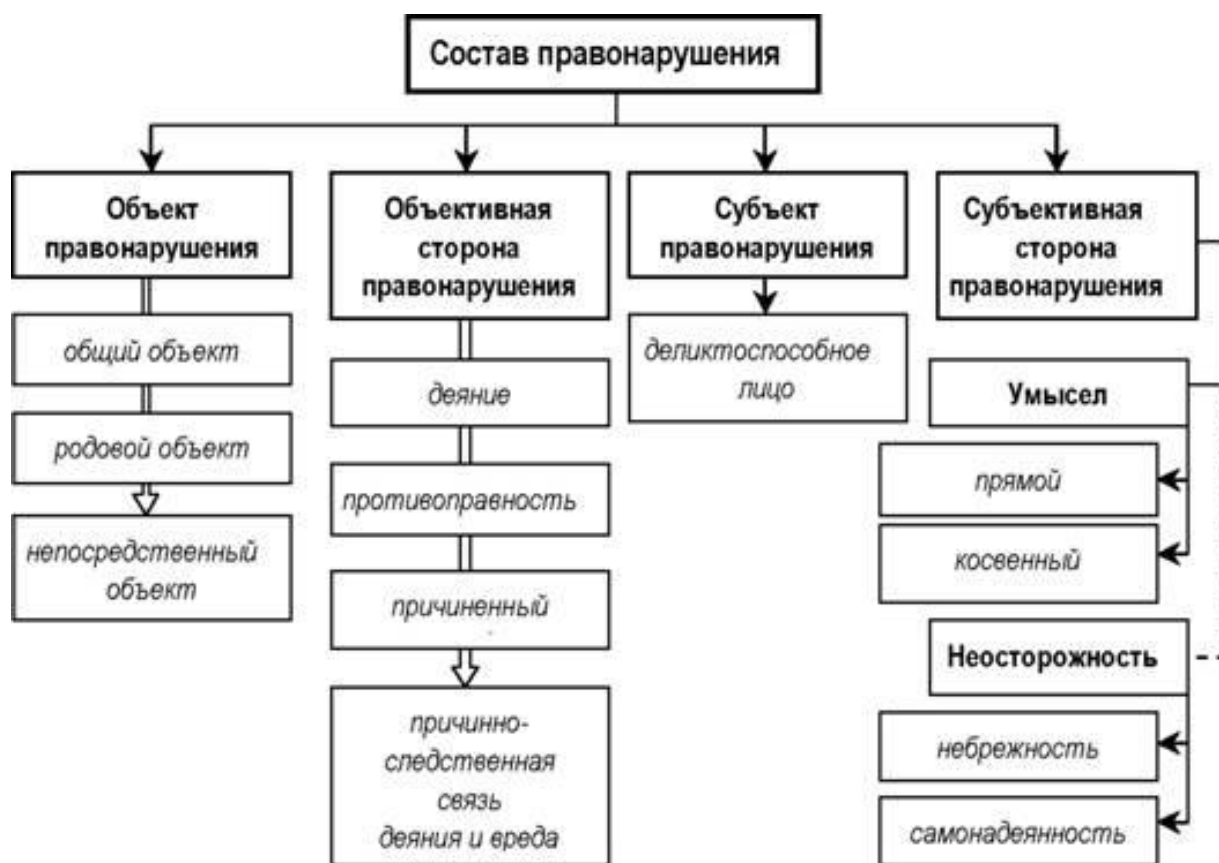
Рис. 1 – Состав правонарушения

Юриспруденцией было выявлено такое понятие, как состав правонарушения. Этот состав отражает всю совокупность основных признаков такого рода деяния, которые отмечены закон творцами достаточными для того, чтобы человека, совершившего деяние подобного уровня, можно было привлечь к ответственности на правовом уровне, которая определяет объект и объективную сторону, а также субъект и субъективную сторону. Состав такого противоправного действия виден на рисунке 1 [4].