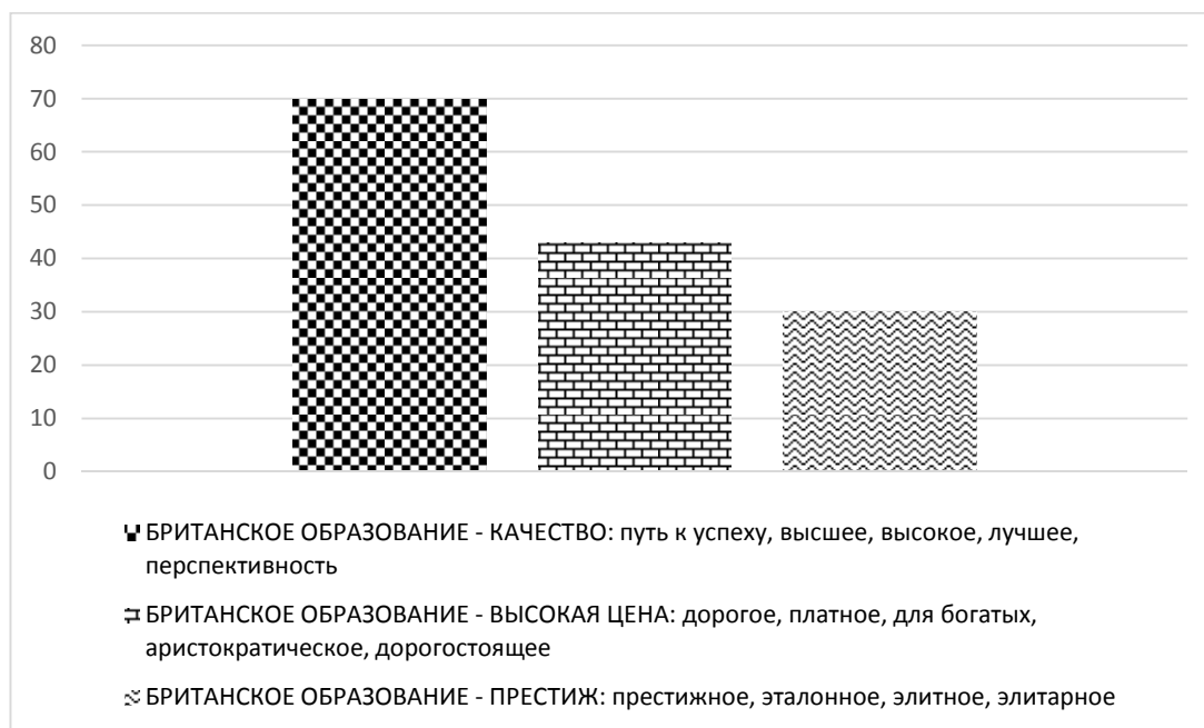
Рис. 1. Ассоциации россиян на стимул «Образование в Великобритании»

Анализ результатов проведенного эксперимента позволил отчетливо разграничить авто- и гетеростереотипные представления о британском образовании. Так, большинство российских респондентов (70%) представляют британское образование такими реакциями: качество, лучшее, перспективность, путь к успеху, высшее, высокое . Среди других ассоциаций выделяются такие, как дорогое, платное, для богатых, аристократическое, для мажоров (43%), а также элитное, престижное, элитарное, эталонное . Итак, выделяются три лидирующие ассоциативные сферы: престижное, качественное, дорогое (рис. 1).