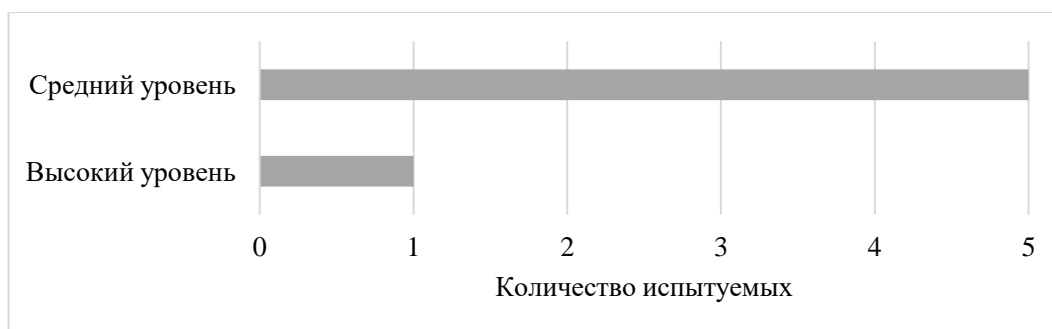
Рис. 5. Распределение испытуемых по уровню сформированности коммуникативных учебных действий

представлены в Приложении 16. Обработка и анализ всех результатов, показал следующие данные, представленные на Рисунке 5.