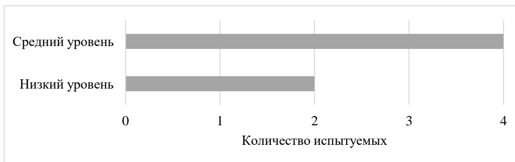
Рис. 2. Распределение испытуемых по уровню сформированности коммуникативных учебных действий (метод беседы с педагогом)