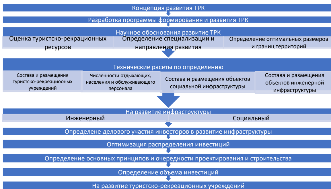
Рис. 1. Последовательность этапов разработки, формирования и развития туристско-рекреационного комплекса.

При планировании программы развития туристического комплекса в регионе необходимо учитывать множество факторов, которые влияют на его успешное развитие. Такие факторы могут быть разделены на основные и второстепенные, которые определяют доступность и привлекательность территории для туризма. Важность этих факторов может различаться от местности к местности, поэтому при разработке программы развития учитываются все условия, влияющие на размещение и развитие туристических объектов. Одной из ключевых целей при разработке программы является оценка экономической выгоды от инвестиций в туристические объекты и их соотношение с затратами.