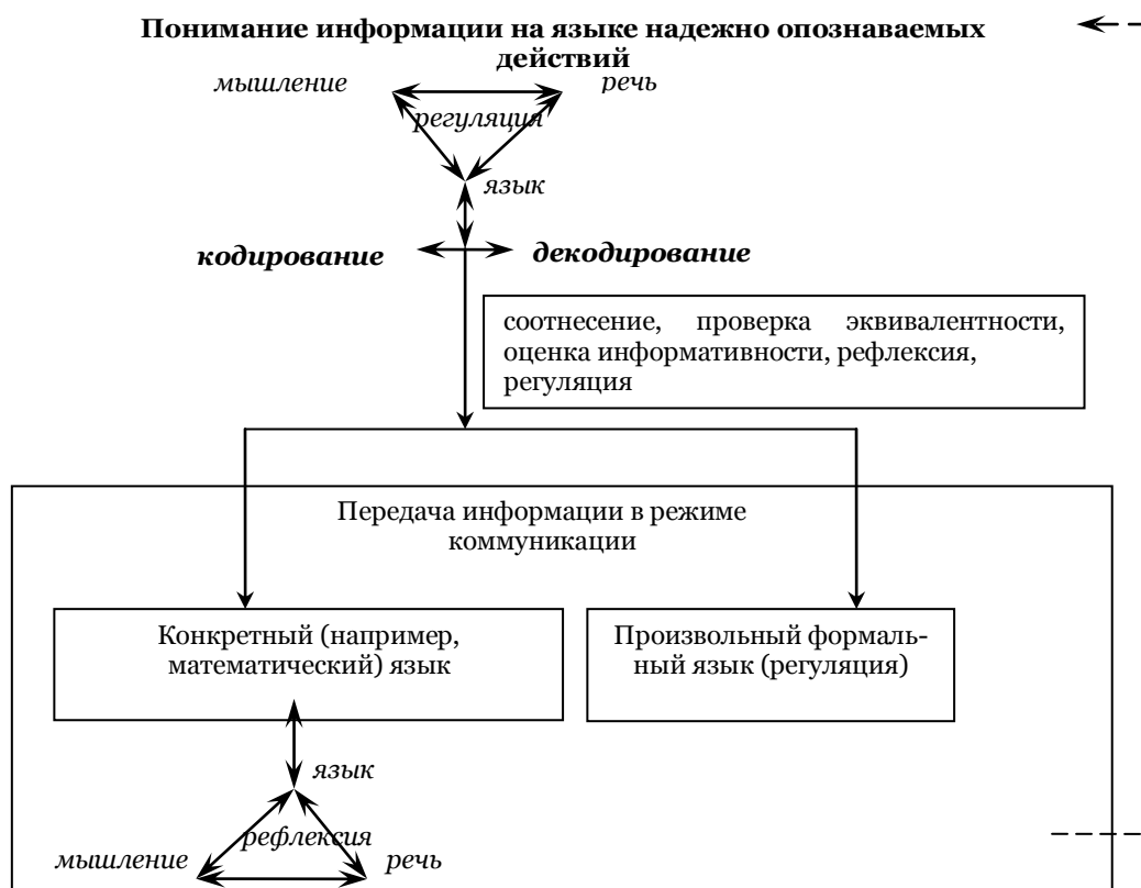
Рис. 3. Схема структуры метода языкового менеджмента

Рассмотрим с позиции целесообразности включения в технологию развития критического мышления метод «языкового менеджмента» [7] (рис. 3).