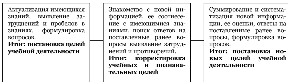
Рис. 1. Механизм развития знаний учащихся в режиме ТРКМ