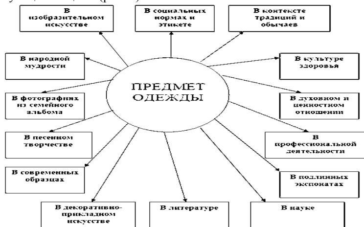
Рис.1. Схема многомерного погружения в культуру посредством одного предмета одежды.

Один и тот же предмет одежды представляется и как исторический источник, и как источник знаний по литературе или изобразительному искусству, и как предмет технологии, обществоведения, культуры здоровья или наук этики и эстетики. Идея хороша тем, что позволяет ребенку выйти из границ укоренившихся представлений о предмете в пространство безграничной возможности обзора. Данное направление развивает интеллектуальную инициативу детей на основе продолжения мыслительной деятельности за пределы обычных представлений [1]. Происходит проникновение вглубь образовательного объекта, рассмотрение его через «увеличительное стекло» или можно сказать выход в более широкое «пространство» одного предмета. Эта способность мыслить в разных направлениях – путь «дивергентного мышления». Такой комплексный подход в деятельности музея моды даёт целостное, многомерное восприятие на первый взгляд обыкновенного предмета одежды: варежек, шарфа, пояса, рубахи, галстука и т.д. Один предмет одежды становится главным «действующим лицом» (рис. 1).