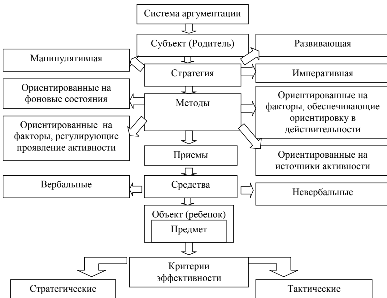
Рис. 1. Модель структуры воспитательных воздействий

Как известно, любое психологическое воздействие оказывает влияние на три сферы личности: эмоциональную, когнитивную, поведенческую (Ю.К. Баженов, В.Г. Зазыкин, Р.С. Немов). Исходя из этого можно выделить три типа воспитательных воздействий, каждый из которых обладает своим содержательным наполнением структуры воздействия (стратегией, методами, приемами, средствами, системой аргументации, эффективностью воздействия): эмоциональные, когнитивные и поведенческие. Эмоциональные воспитательные воздействия – это действия, направленные на поддержание положительного эмоционального состояния ребенка и связанные с эмоциональной сферой родителей. Когнитивные воспитательные воздействия – это рациональные, аргументированные действия родителей, направленные на разум ребенка, осуществляемые в процессе сотрудничества и способствующие изменению в когнитивной сфере ребенка. Поведенческие воздействия – это императивные действия, направленные либо на прекращение деятельности и поведения ребенка, либо на их сиюминутное изменение. Выделение целостности как одной из характеристик воздействия дает возможность предположить существование четвертого – комбинированного типа воспитательных воздействий, который можно определить как действия родителей, направленные на эмоциональную, когнитивную и поведенческую сферы ребенка, основанные на безусловном принятии и осуществляемые в процессе взаимодействия.