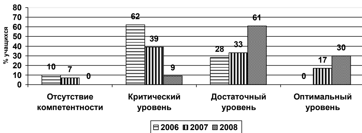
Рис. 2. Распределение выпускников естественнонаучных классов разных лет обучения по уровням эколого-валеологической компетентности

Данные итоговой диагностики выявили позитивную тенденцию в развитии у старшеклассников эколого-валеологической компетентности. Во-первых, обнаружены различия между естественнонаучными классами разных лет выпуска (рис. 2). Экспериментальная группа выпускников естественнонаучного класса 2008 года, для которой был обеспечен широкий комплекс условий инновационного пространства гимназии, имеет превосходство на оптимальном и достаточном уровнях по сравнению с выпускниками подобного класса 2007 года, и значительное превосходство по сравнению с выпускниками 2006 года.