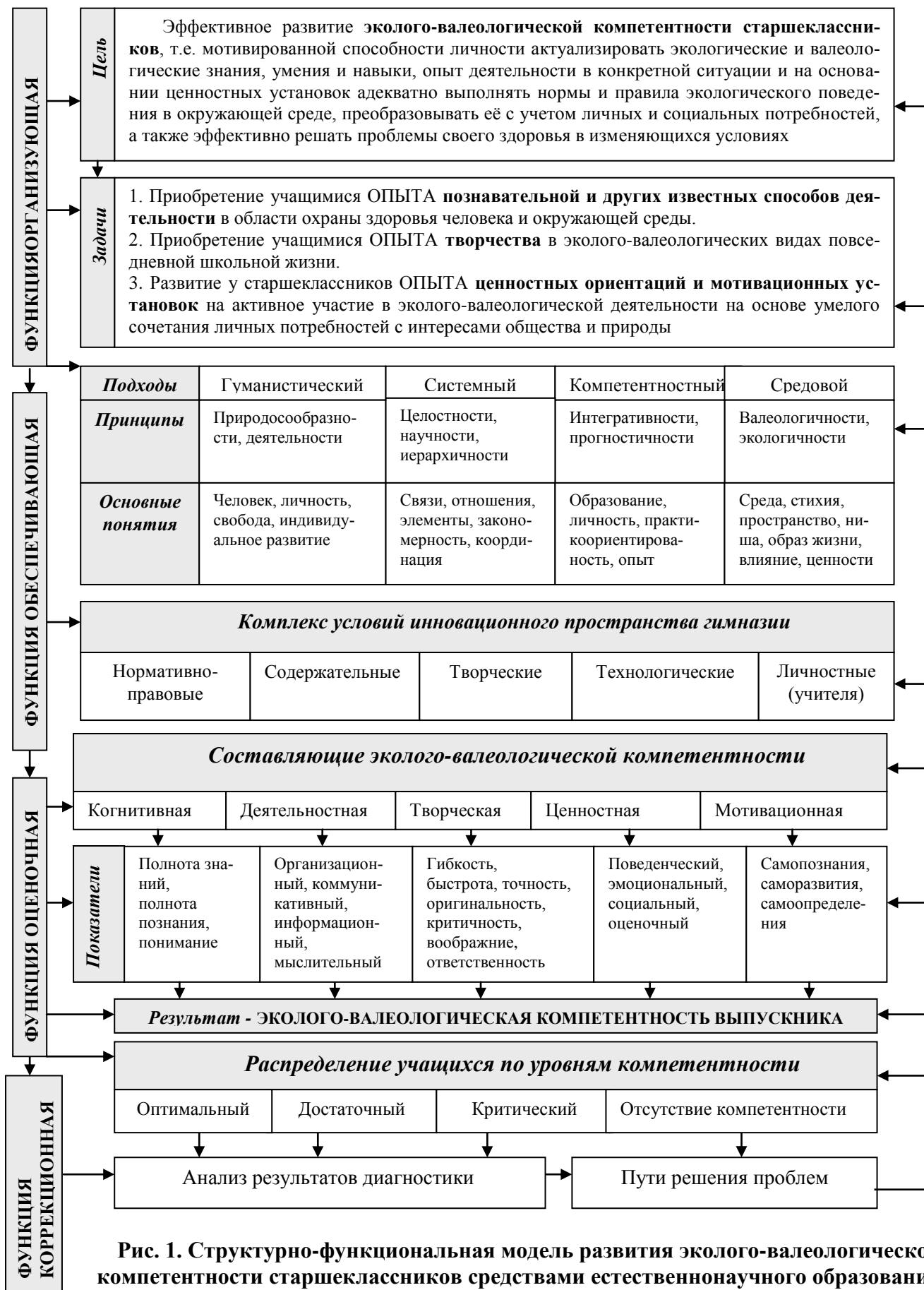
Рис. 1. Структурно-функциональная модель развития эколого-валеологической компетентности старшекласников средствами естественнонаучного образования