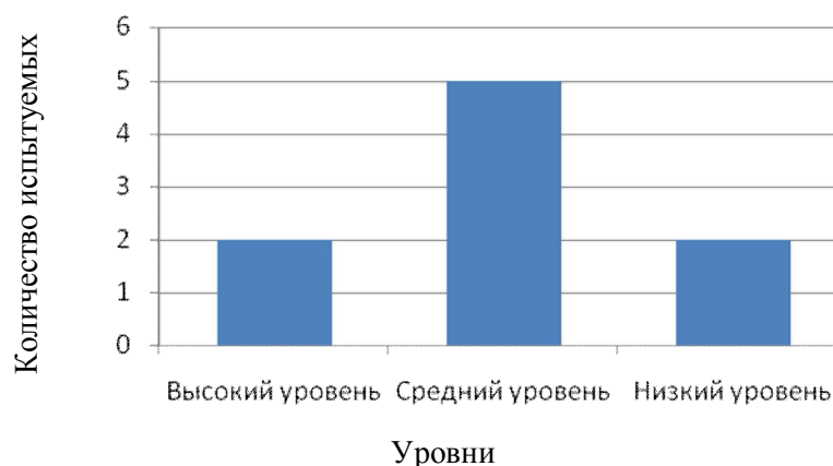
Рис 2. Результаты второго блока на изучение правовых умений

Для определения уровня правовой компетенции для каждого респондента нами был высчитан средний балл после проведения обоих блоков. Таким образом, при использовании 10-ти бальной системы оценивания, уровень правовой компетенции определялся соответственно: высокий уровень правовой компетенции – 9-10 баллами, средний от 7 до 8 баллов и низкий от 0 до 6.