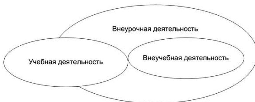
Рис. 2. Взаимосвязь внеурочной, учебной и внеучебной деятельности школьников (по А.Л. Трофимовой) [54].

Представим взаимосвязь внеурочной, учебной и внеучебной деятельности школьников в виде множеств на рис. 2.