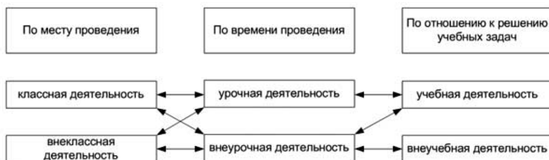
Рис. 1. Взаимосвязь различных видов деятельности школьников (А.Л. Трофимова) [54].

В классе могут проводиться как урочные, так и внеурочные занятия. Многие урочные занятия проводятся внеклассово во внеурочное время, например экскурсии, турпоходы [54]. Из вышесказанного следует, что допустимо отождествлять понятия классной и урочной деятельности, а также внеклассной и внеурочной деятельности (рис. 1).