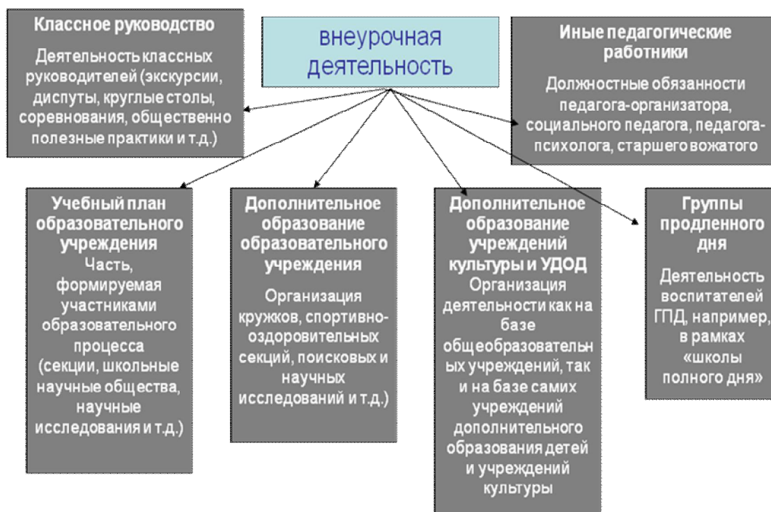
Рис.4. Базовая организационная модель реализации внеурочной деятельности

Внеурочная деятельность базируется на тесном взаимодействии учреждений дополнительного образования и образовательных учреждений, способном оперативно дать конкретный образовательный результат [28].