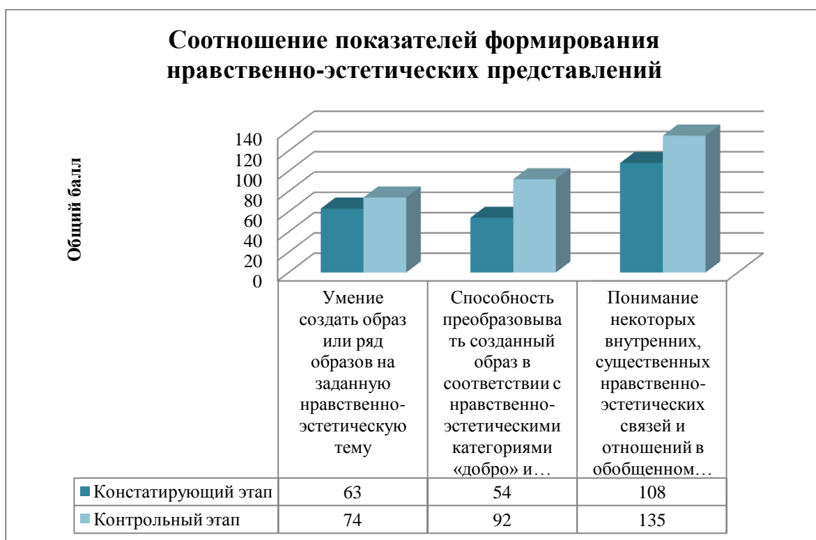
Рис.3 Соотношение показателей развития эстетического восприятия

Результаты сформированности нравственно-эстетических представлений детей по итогам трех этапов опытно-поисковой работы показаны на рисунке 3.