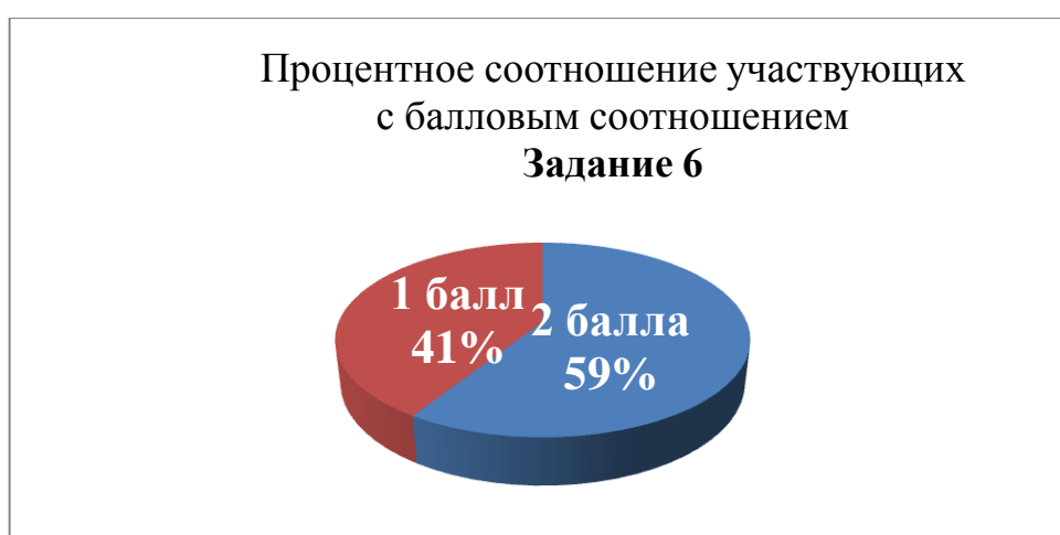
Таблица № 3