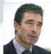
Генеральный секретарь НАТО Андерс Фог Расмуссен