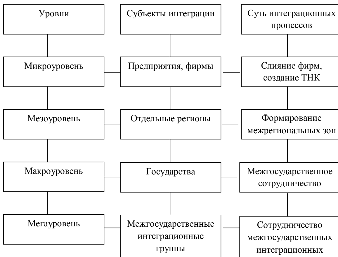
Рис. 1. Уровни международной интеграции

Стоит отметить, что интеграция на микроуровне происходит через экономическое взаимодействие отдельных хозяйствующих субъектов (индивидов, фирм, учреждений и т.п.) «в форме осуществления совместных проектов, научно-поисковых работ, создания совместных предприятий, транснациональных корпораций и т.п.» [Мнацаканян М.О., 2014, с. 137].