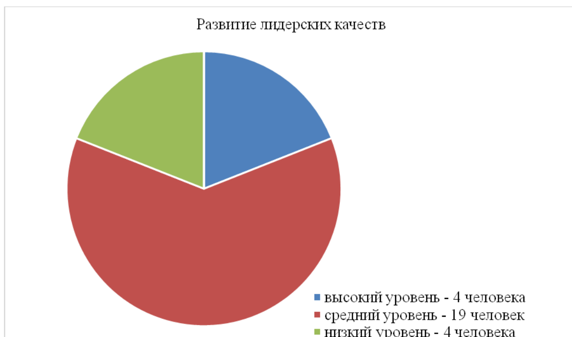
Рис. 1. Развитие лидерских качеств

Так же из исследования мы можем увидеть, что в опрашиваемом классе что коммуникативная функция, творческий потенциал и организаторские способности развиты в средней степени, что говорит о том, что со старшими школьниками требуется проводить работу, с помощью которой у старшего школьника будут формироваться эти способности и функции.