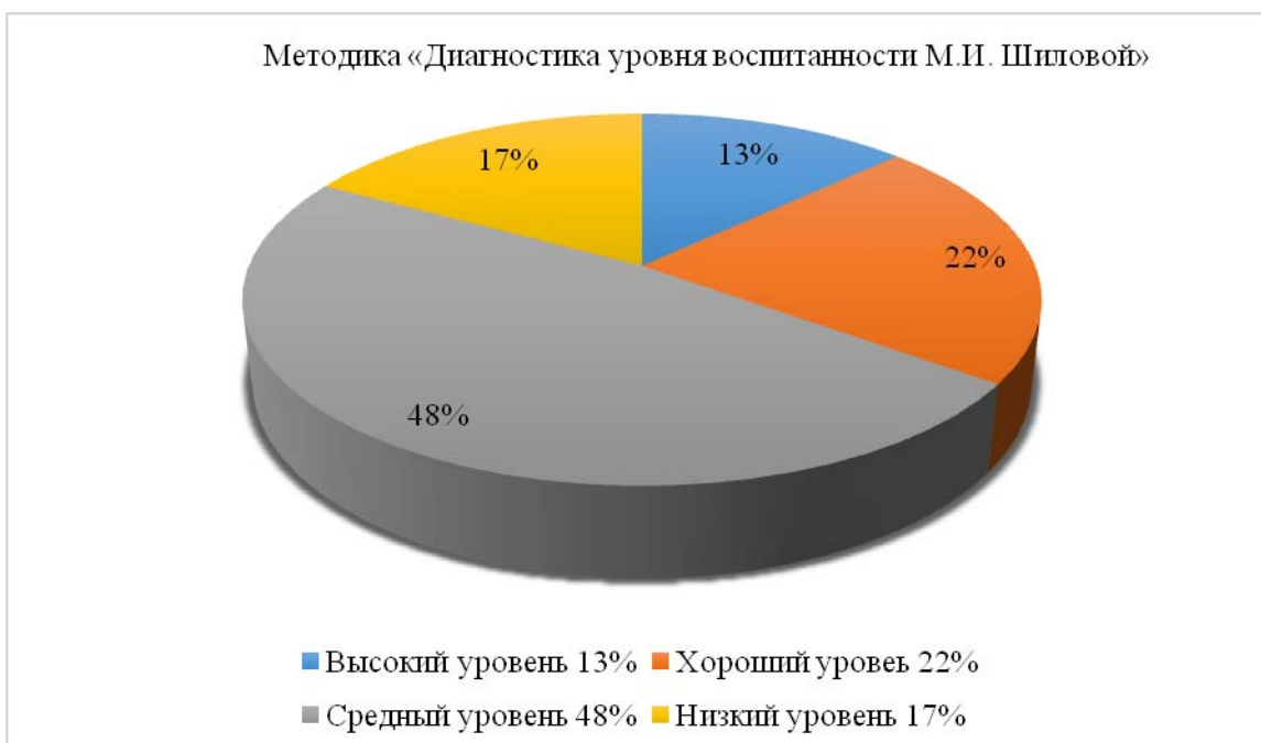
Рис. 1. Результаты методики «Диагностика уровня воспитанности М.И. Шиловой»

Анализируя результаты методики «Диагностика уровня воспитанности М.И Шиловой» у младших школьников было выявлено, что у 3 человек (13%)– высокий уровень воспитанности, у 5 человек (22%)–хороший уровень воспитанности, у 11 человек (48%) – средний уровень воспитанности и у 4 человек (17%)–низкий уровень воспитанности.