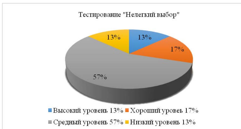
Рис. 4. Результаты тестирования «Нелегкий выбор»

Результаты тестирования «Нелегкий выбор» представлены на рисунке 4.